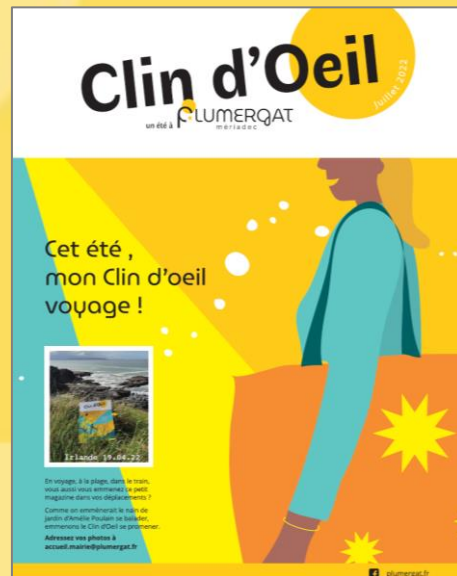
Juillet 2022 (Été)