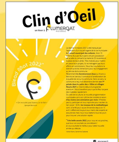
Janvier 2022 (Hiver)