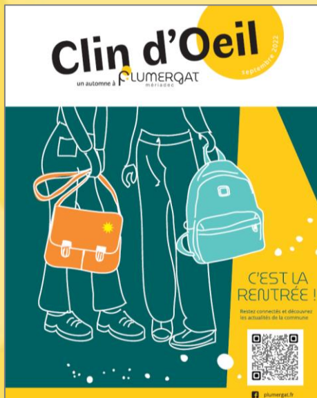
Septembre 2022 (Automne)