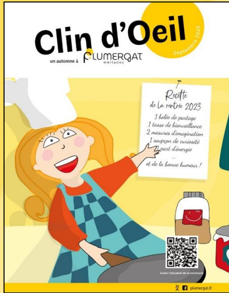
Septembre 2023 (Automne)