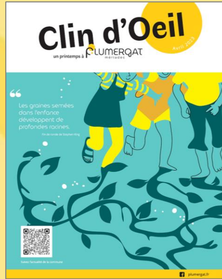
Avril 2023 (Printemps)