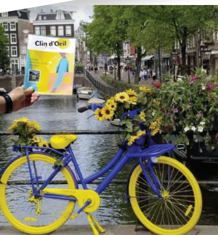
Pays Bas Amsterdam