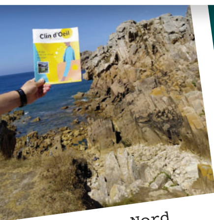
Bretagne Nord Pointe de Primel