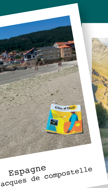
Espagne lacques de compostelle