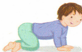
SE METTRE À 4 PATTES