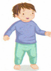
SE TENIR DEBOUT

RIEN NE SERT DE BRÛLER LES ÉTAPES : C'EST EN LAISSANT L'ENFANT LES FRANCHIR L'UNE APRÈS L'AUTRE, À SON RYTHME, QU'IL PROGRESSERA.