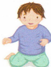
SE METTRE À GENOUX